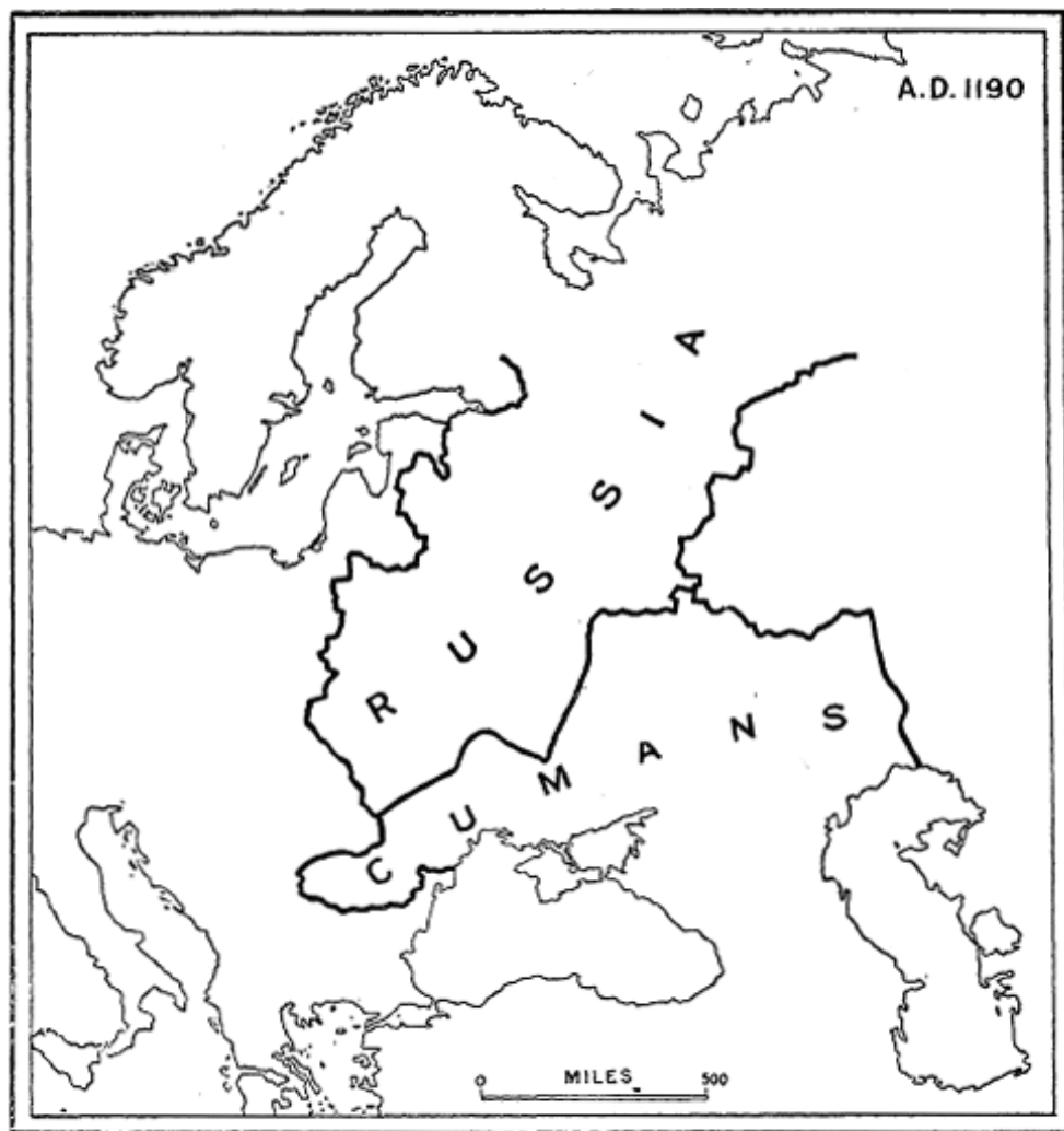
Figura 2. División política de Europa Oriental en la época de la Tercera Cruzada

blecieron al sur del Danubio una casta dominante, habiendo dejado su nombre en el mapa, aunque su idioma se ha rendido ante sus súbditos eslavos.