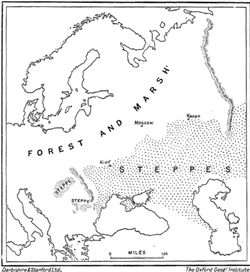
Figura 1. Europa Oriental antes del siglo XIX