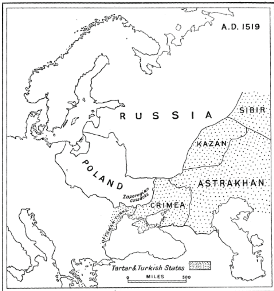
Figura 3. División política de Europa Oriental al llegar al trono Carlos V

Darbishire & Stanford Ltd.